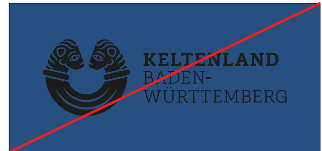
Das schwarze Logo nicht auf dunklem Grund verwenden