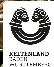
Nebenlogo hoch Box