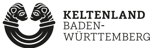
Hauptlogo quer negativ