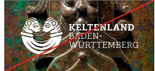
Kein Logo ohne Box auf unruhigen Hintergründen