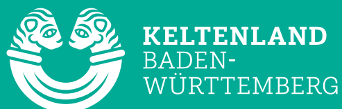
Hauptlogo quer negativ