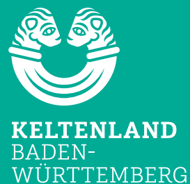
Nebenlogo hoch negativ