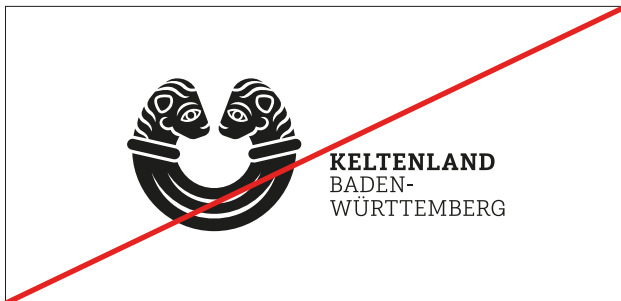
Keine Veränderung der Proportionen von Signet & Schrift