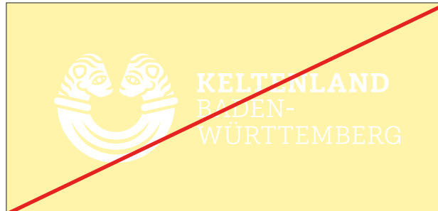
Das weiße Logo nicht auf hellem Grund verwenden