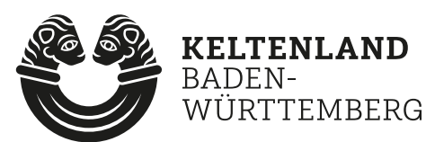
Hauptlogo quer Box