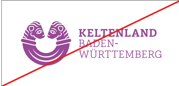
Keine Einfärbung des Logos