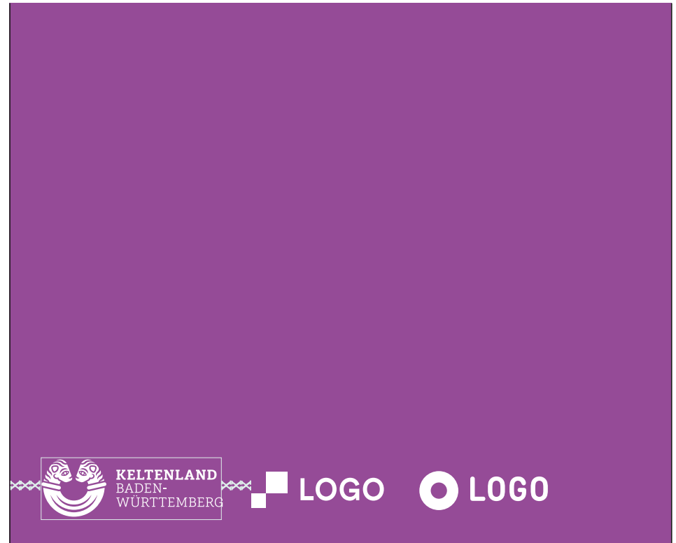
Logoleiste negativ / Auf farbiger Fläche