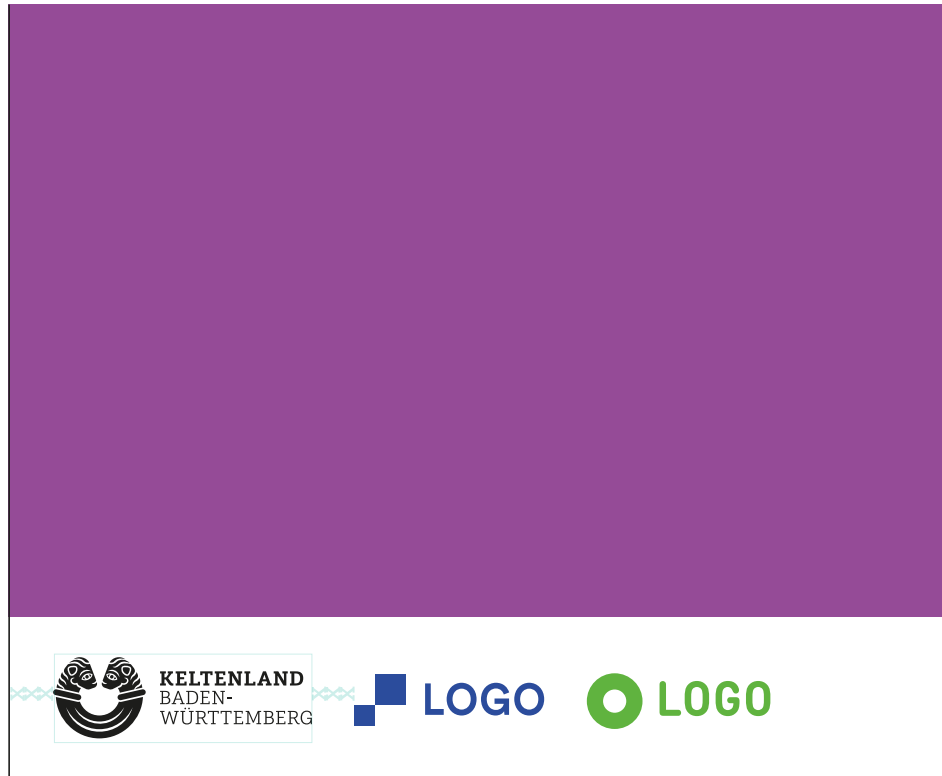
Logoleiste weiße Fläche